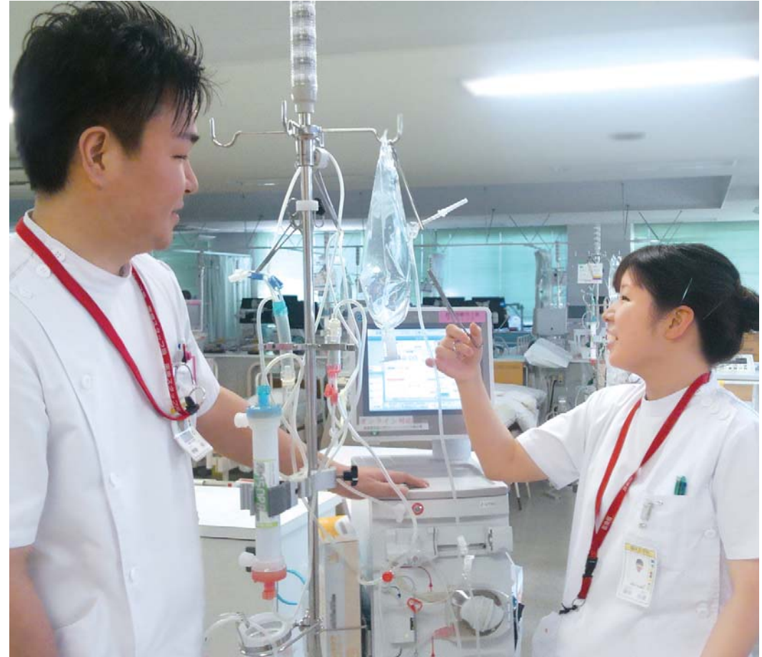
表紙のひと：臨床工学技士 日々真摯に業務に取り組んでいます！